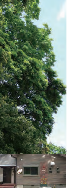
よいほ 四五百の森蔭に、ひっそり佇む 小さなお弁当屋さん

もちろん、今までの電話・LINEからのご注文もOKです。 ご不明な点がございましたら、お気軽にお問合せくださいませ。